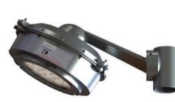
FLY 105P/2 ec nR Poste 30°