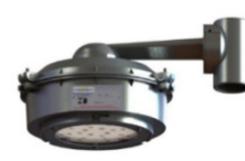
FLY 106P/2 ec nR Poste 90°