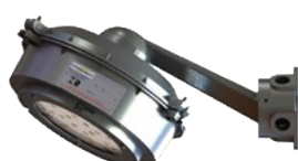
FLY 105/2 ec nR Arandela 30°