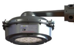
FLY 106/2 ec nR Arandela 90°