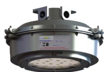
FLY 107/2 ec nR Plafonier